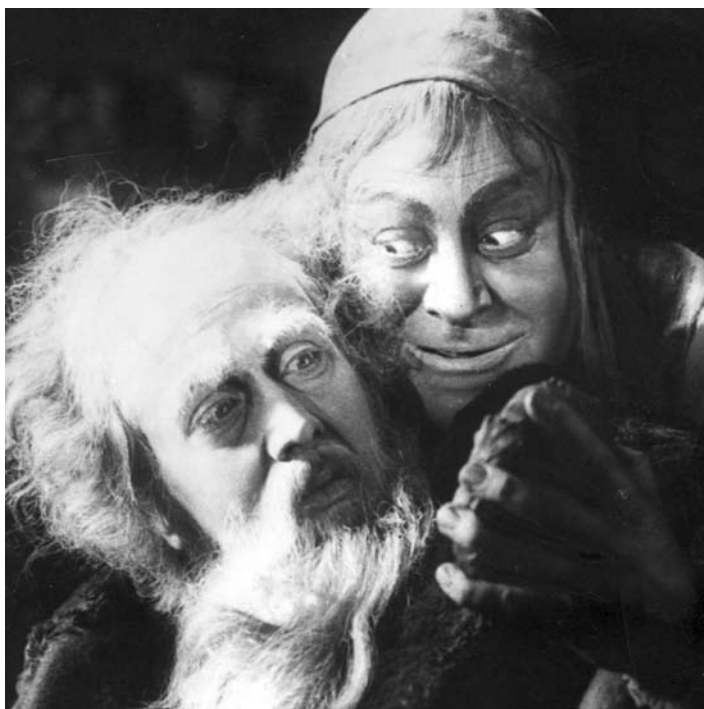
W. F. MURNAU. FOTOGRAFÍAS DE Faust. Eine deutsche Volkssage . FOTOGRAFÍAS DIGITALES, DETALLES (ALEMANIA, 1926)

Faust Eine deutsche Volkssage (FAUSTO. UNA LEYENDA POPULAR ALEMANA)